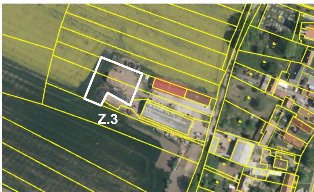
Zákres do mapy KN.